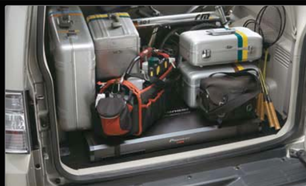
Yderst kompakt og fleksibel konstruktion

Se de komplette features og specifikationer på side 125.